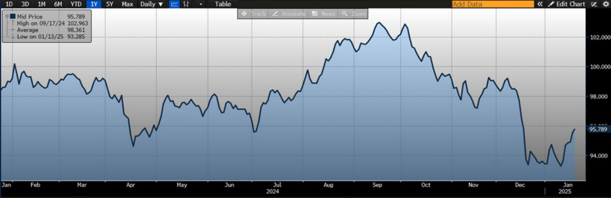
GRAFICO DOW JONES